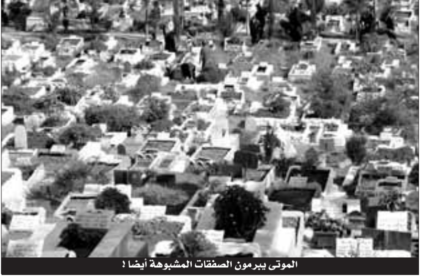
الموتى يبرمون الصفقات المشبوهة أيضا !

علمت "الشروق" من مصادر موثوقة أن قاضي التحقيق لدى محكمة باب الوادي بالعاصمة انتهى مؤخرا من التحقيق في قضية "مؤسسة تسيير المقابر والجناز" التي تورط فيها ثمانية متهمين وعلى رأسهم مدير مؤسسة حفظ الجثث ورئيس الدائرة التقنية بذات المؤسسة، رفقة رئيس الإدارة والمحاسبة ورئيس مصلحة المالية بالإضافة لثلاثة مسيرين لشركتين خاصتين، حيث تم وضعهم تحت الرقابة القضائية، بعد ما وجهت لهم تهم تتعلق بإبرام صفقة مخالفة للتشريعات المعمول بها بغرض إعطاء امتيازات غير مبررة للغير وإساءة استغلال الوظيفة والتزوير واستعمال المزور في المحررات التجارية والوثائق الإدارية.