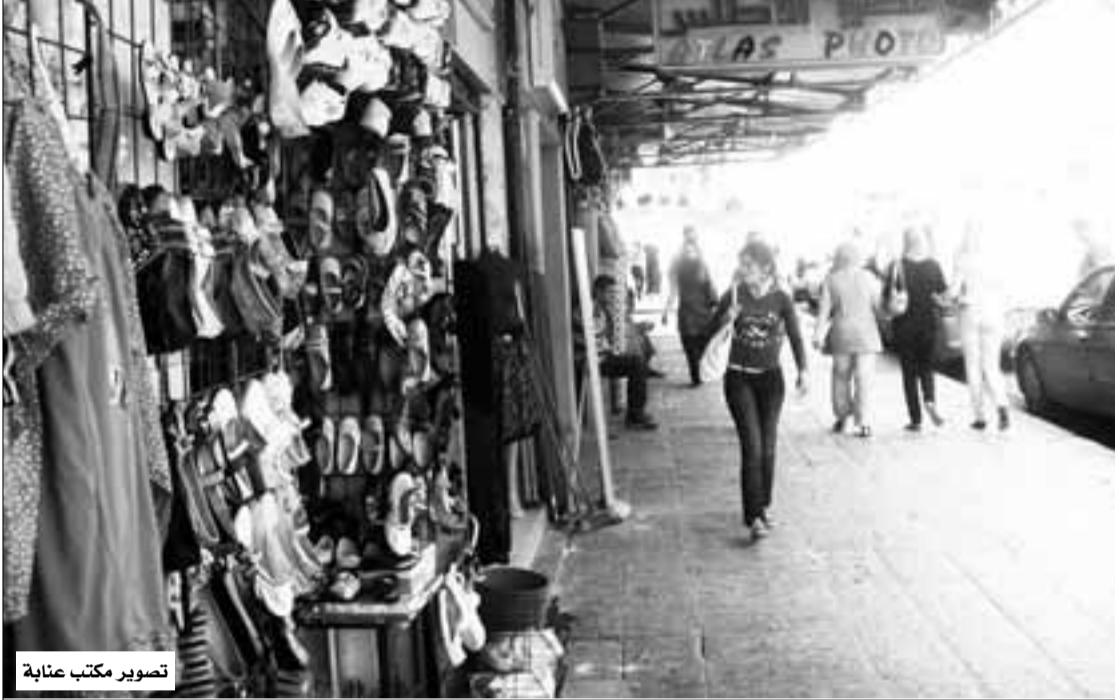
تصوير مكتب عنابة

بالمصالح المكلفة بالتجارة والمنافسة بولاية عنابة واتخاذ الاجراءات القانونية للممارسة المشروعة. للإشارة أن فرقا مختلطة بين مصالح الأمن والادارة والتجارة بولاية عنابة قد شرعت مباشرة بعد عطلة عيد الفطر المبارك في تنفيذ نص تعليمية وزارية مشتركة تتضمن التطهير الفوري لساحات وشوارع عنابة من كافة أشكال التجارة الطفيلية وتجارة الأرصفة مهما كان نوعها ؟