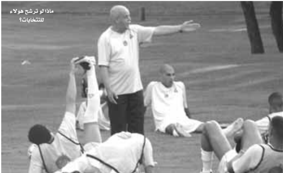
ماذا لو ترشح هؤلاء للتحديات؟

ليس سهلا على أي شخصية سياسية أو حزبية رياضية أو فنية أو ثقافية أن تتقنع عقلية الجزائري بالتجمهر من حولها وترديد شعاراتها وأغانيها أو تقليد ملامحها إلا إذا كانت هذه الشخصية الصورة الرمز التي يرى فيها الجزائري أماله، تطالعته، أحلامه، فبين الشخصيات القابعة في قصر الدكتور سعدان وبين أبناء الشيخ راجع سعدان تكمن قوة من له القدرة على إخراج الجزائري من بيته.