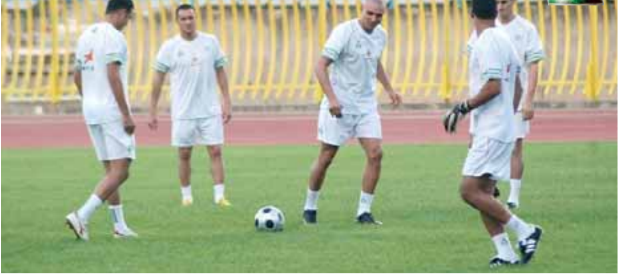
"الشروق" تنقل خبايا آخر تدريبات "الخضر"