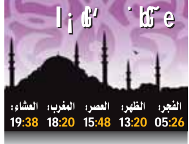
الجزائر: المغرب: العصور: العشاء: 19:38 18:20 15:48 13:20 05:26