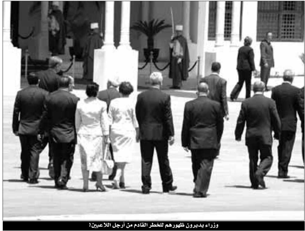
وزراء يدبرون ظهورهم للخطر القادم من أرجل اللاعبين!

الحكومة بتشكيلتها الحالية وتشكيلاتها السابقة تعاني منذ الاستقلال من الأوراق الصفراء والحمراء التي تشهر في وجهها بسبب فقدان ثقة المواطن فيها وعدم التفاهة حولها، هذه الهوة ما بين الجهاز التنفيذي والمواطن تعمقت أكثر فأكثر خلال العشرية السوداء بسبب الوضع الاقتصادي الذي كانت تعانيه البلاد والذي انعكس بصورة آلية على الوضع الاجتماعي على كل الجزائريين في ظل