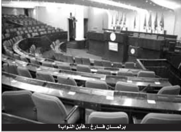
برلمان فارغ.. فأين النواب؟

المسؤولون على البرلمان، لا يرون في هذه "البطالة" مشكلة، فهم يعتقدون أن العمل التشريعي يبقى رهينة بما يحال من الأمانة العامة للحكومة من مشاريع قوانين، يكون قد تسبب في تعطيلها ما يدور من أخبار حول حدوث تغيير حكومي وشيك..