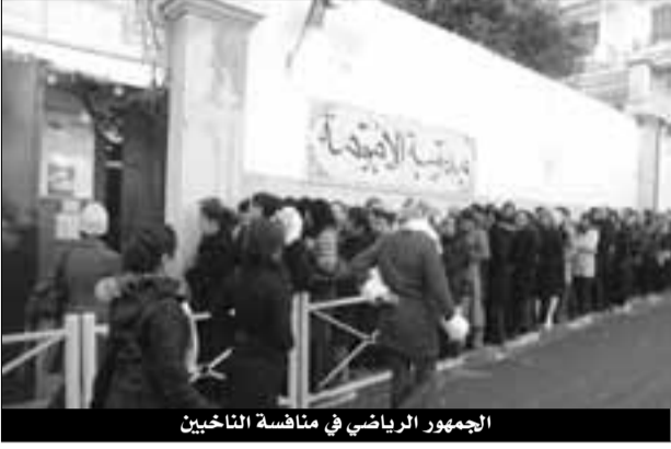
الجمهور الرياضي في مناقشة الناخبين

الخارطة السياسية بفضل مشاركتهم القوية في الاستحقاقات، مكتفين بحفظ الرمز الذي تحمله التشكيلة التي يناصرونها حينما يتوجهون إلى صناديق الاقتراع. كما كان الاستفتاء حول قانون الوثام المدني الذي جرى في 6 سبتمبر 1999م، الذي زكاه 98,63 % من الناخبين، من أنجح المواعيد الانتخابية على الإطلاق، بسبب الرغبة الملحة التي أبداها الشعب لتجاوز مرحلة العنف واللااستقرار والوصول إلى بر الأمان، عن طريق حقن الدماء وفتح صفحة جديدة، بدليل أن حجم المشاركة تجاوز 85 في المائة.