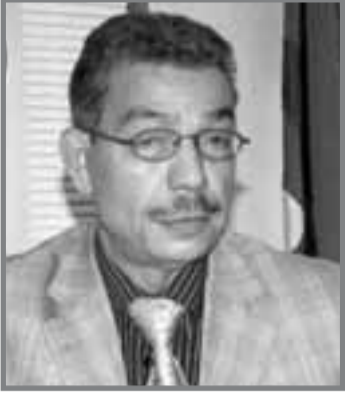
■ بقلم: نذير مسمودي

وبعكس ما تقتضيه هذه النظرية التي لم يرق على صحتها أي دليل، فإن سيادة موقف الصراع، ثم الانقسام في حالة حركة مجتمع السلم، أسبابا وخلفيات، تتجاوز القراءات الساذجة، والتفسيرات البسيطة التي تجعل من تلك الحالة، حالة طارئة، يمكن تجاوزها بسهولة.