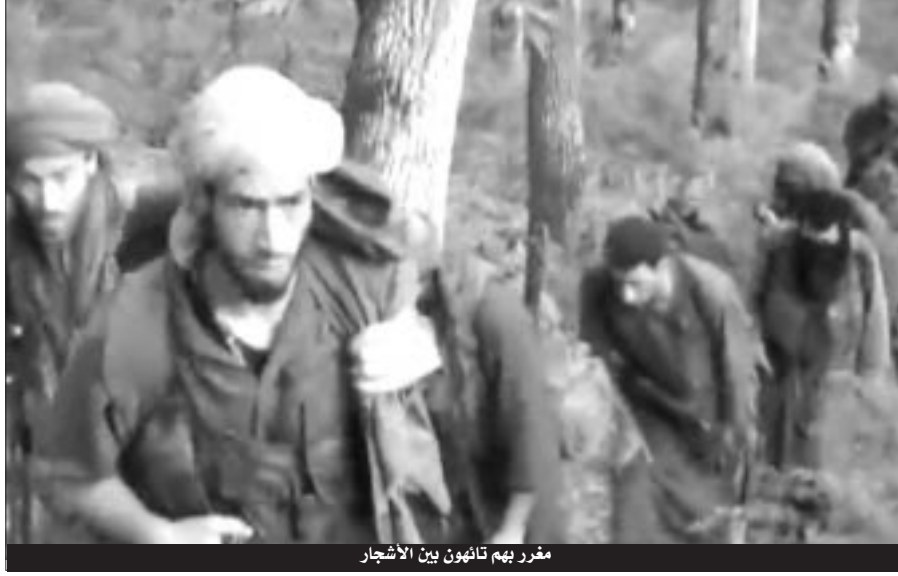
مفر بهم تائهون بين الأشجار

القضية تتعلق بخمسة شبان تتراوح أعمارهم ما بين 20 و26 سنة، أغلبهم من ولاية بومرداس، وجهت لهم تهم تتعلق بالإشادة وتشجيع الأعمال الإرهابية والانخراط في جماعات إرهابية مسلحة، ووضع عمدا متفجرات في الطريق العمومي. وحسب ما دار في جلسة المحاكمة أمس، فإن القضية تتعلق بانخراط الشبان الخمسة في صفوف الجماعات الإرهابية ببومرداس خلال أبريل 2007، وحول علاقاتهم بوضع قنبلة تقليدية الصنع بطريق سي مصطفي، إستهدفت عناصر الدرك الوطني، ويتخيل من أمير الجماعة المتواجد في حالة فرار (م.ي) الملقب بطلحة، ومساهمة كل من المتهم (ل.ي)، هو من حضر الحفرة، أما المتهم (ز.ب) فهو من وضع القنبلة في الحفرة وانفجرت في اليوم الموالي عن طريق الهاتف اللاسلكي، بمعية أمير سرية الأرقم (م.ي) طلحة، إلا أنهم أنكروا أسس تصريحاتهم كلها أمام المحكمة. أما فيما يخص المتهم (ب.أ) الذي سبق وأن إستفاد من المصالحة الوطنية خلال 2006، فقد تورط بعد خروجه من المؤسسة العقابية في تمويل الجماعات الإرهابية بالموونة الغذائية، ونفس الشيء بالنسبة للمتهم (خ.م)، المدعو قوشي، الذي كان يمول الجماعات بالغذاء، والمتهم (م.س) الذي كان يشتغل في تهريب