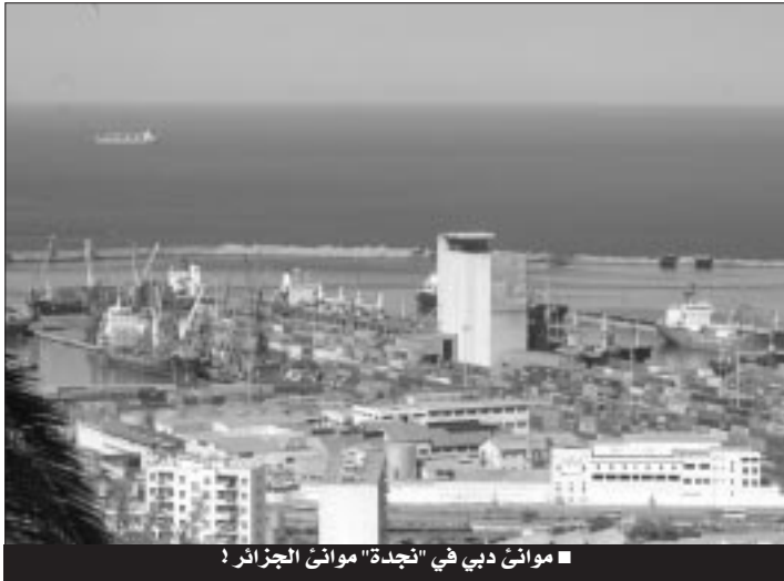
■ موانئ دبي في "نجدة" موانئ الجزائر!

ويؤكد الاتفاق أن "خدمات النقل ستتحسن بتوفير بواخر بحرية تجارية جديدة لخفض التكاليف الحالية، وإدخال ميناء العاصمة في شبكة النقل البحري الدولي ووفق المعايير الدولية"، حيث يخسر ميناء العاصمة حاليا 250 مليون أورو بسبب بقاء السفن راسية فيه دون شحن أو تفريغ، مضيفا "توسيع نشاط الحاويات بميناء جن جن". وقد أسندت عملية التسيير لشركة "موانئ دبي"، وأعطى حق الامتياز في تسيير نهائي الحاويات على مدة 30 سنة، وبعاد توقيع اتفاق الشراكة مع المؤسسة الملحقة بميناء العاصمة كل سبع سنوات، وحددت مساحة استغلال نهائي الحاويات بـ 28,5 هكتار، وتمتد حدود الشركة على محور المواقف التالية، الأرصفة 30، 31، 32، 33، وإلى غاية مغلق الميناء في الزاوية 26 و30 ومحور المول 7، وتبلغ طاقة الاستغلال وفق الأهداف المحددة 756 ألف حاوية من صنف 20 قدم سنويا، وتكون بقدرة أقل في السنة الأولى والثانية، بطاقة 288 ألف حاوية سنة 2009، وبطاقة 643 ألف حاوية سنة 2010، و756 ألف حاوية بداية من سنة 2015.