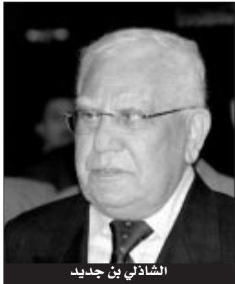
الشاذلي بن جديد

حول اختيار المرحوم رابع بيطاط ضمن مجموعة القادة الخمسة، وهم كانوا يفضلون عضوية عبد الرحمن بيراس الذي لم يحضر اللقاء. ورداً عن أسئلة "الشروق" حول اختيار منطقة حمام بني صالح في الطارف لعقد المؤتمر الذي حول فيها بعد إلى الصومام، فند عدد من المجاهدين الذين كانوا يرافقون عمار بن عودة مثل هذه التصريحات وقالوا: "إن الشاذلي على خطأ، ولا ندرى دوافع مثل هذه