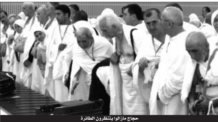
حجاج ما زالوا ينتظرون الطائرة

قصد السماح لـ 14 ألف حاج السفر بين الجزائر وجدة أو المدينة فضلا عن تخصيص شركة تسيير خدمات وهيكل مطارات الجزائر النهائي 3 خصيصا لرحلات الحج مع وضع تجهيزات خاصة لتسهيل ظروف الاستقبال وإعلام المسافرين من إشارات ومصليات، كما تكشفت الخطوط الجوية الجزائرية بنقل عدد من الحجاج الموريتانيين والسنغاليين وكذا من الصحراء الغربية.