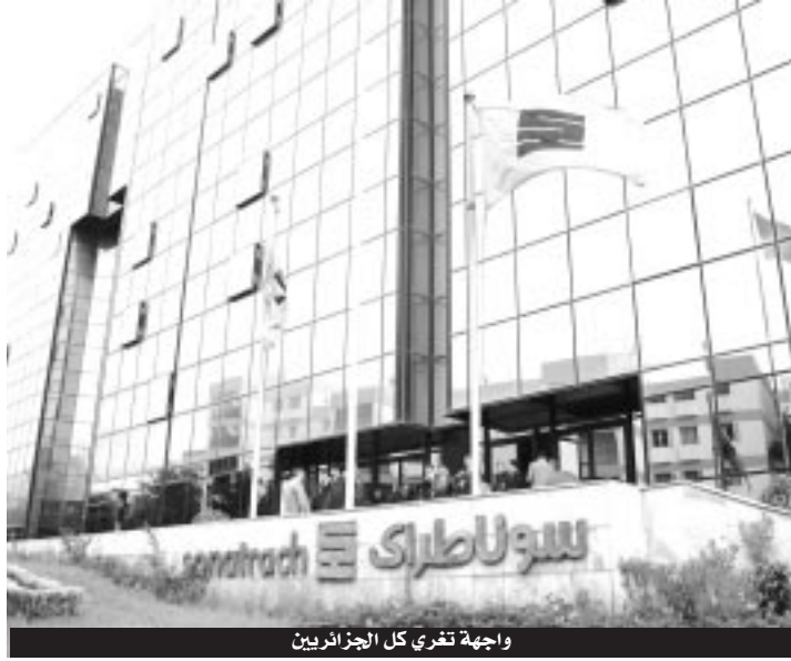
واجهة تقري كل الجزائريين

وكشف مصدر مطلع من داخل المجمع استمرار نزيف الإطارات، بسبب رفض إدارة سوناطراك الاستجابة إلى مطالب المهندسين المختصين المتمثلة