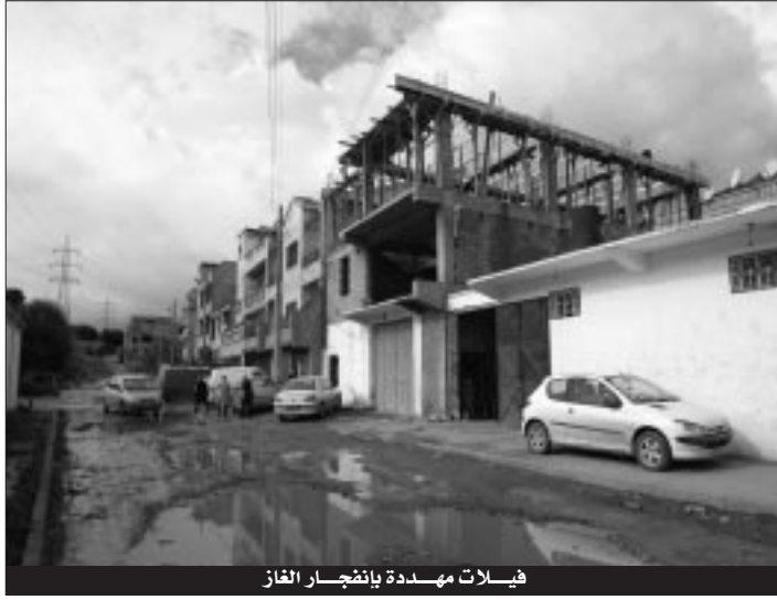
فيلات مهددة بانفجار الغاز

يواجه أصحاب أكثر من 150 فيلا موزعة عبر العاصمة قرارات تسوية وضعية البناء الخاصة بسكنااتهم بعد قرار رفع سونلغاز دعوى قضائية ضدهم بسبب مجاورة سكنااتهم أو بناؤها فوق أنابيب الغاز العالية الضغط، واستلم هؤلاء إشعارات الحضور إلى المحكمة قبل أسبوع في انتظار مثلولهم بداية الأسبوع المقبل بعد تأسيس سونلغاز كطرف مدني.