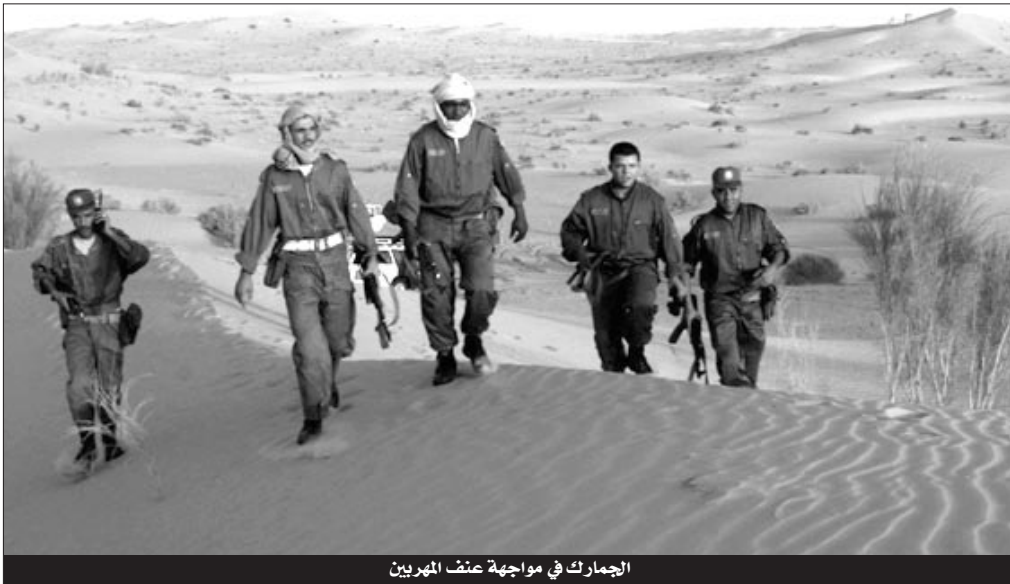
الجمارك في مواجهة عنف المهربين

سجلت المصلحة الجهوية للجمارك بولاية تلمسان أكثر من 17 اعتداء استهدف أعوان الجمارك أثناء أداء مهامهم من طرف المهربين أغلبها على مستوى مصلحة مغربية على خلفية أنها منطقة حدودية ومنطقة نشاط وعبور المهربين من وإلى الحدود الجزائرية المغربية، وأصيب العديد من أعوان الجمارك خلال عمليات الحجز أو أثناء تواجدهم في نقاط المراقبة بجرور متفجرة، آخرها إصابة عون على مستوى العين بعد رشقه بالحجارة عند مروره كادت تفقده عينه، وكثف المهربون من اعتداءاتهم منذ صدور قانون مكافحة التهريب الذي شدد العقوبات على المتورطين بعد أن يتم حجز المركبة أو السلعة فقط.