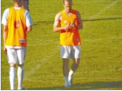
أشيو.. وعادت ذكريات سوسة