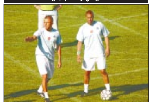
غلاس.. من هنا طريق الفوز