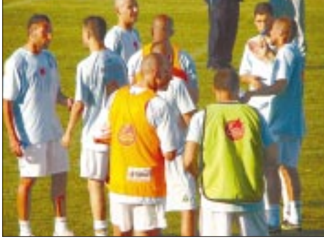
تضامن وإصرار على الفوز