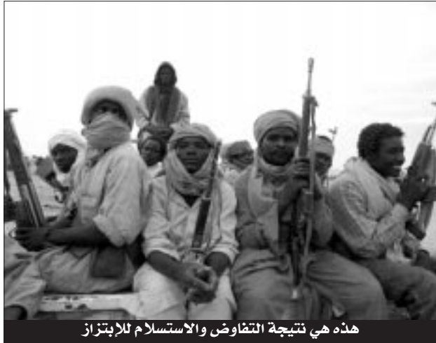
هذه هي نتيجة التفاوض والاستسلام للإبتراز

وستل المسؤول عن "موقف" دولة مالي التي كانت تلعب دور الوسيط في المفاوضات بين الخاطفين وبلدان الرهائن بعد إعدام الرهينة البريطانية لمعرفة ما إذا كانت مالي "تأسف" ليجيب "شعرا قليلا بأننا وقعنا في فخ" وفي ذلك اعتراف ضمنى بدور الوساطة الذي