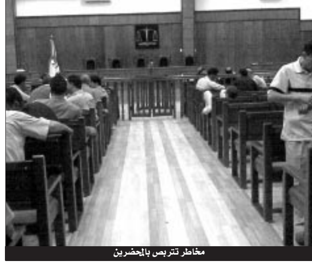
مخاطر تتربص بالمحضرين