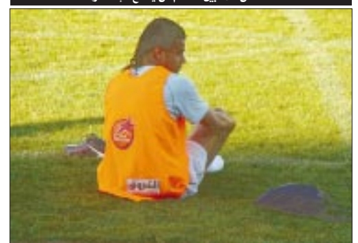
متى تأتي فرصة حاج عيسى!