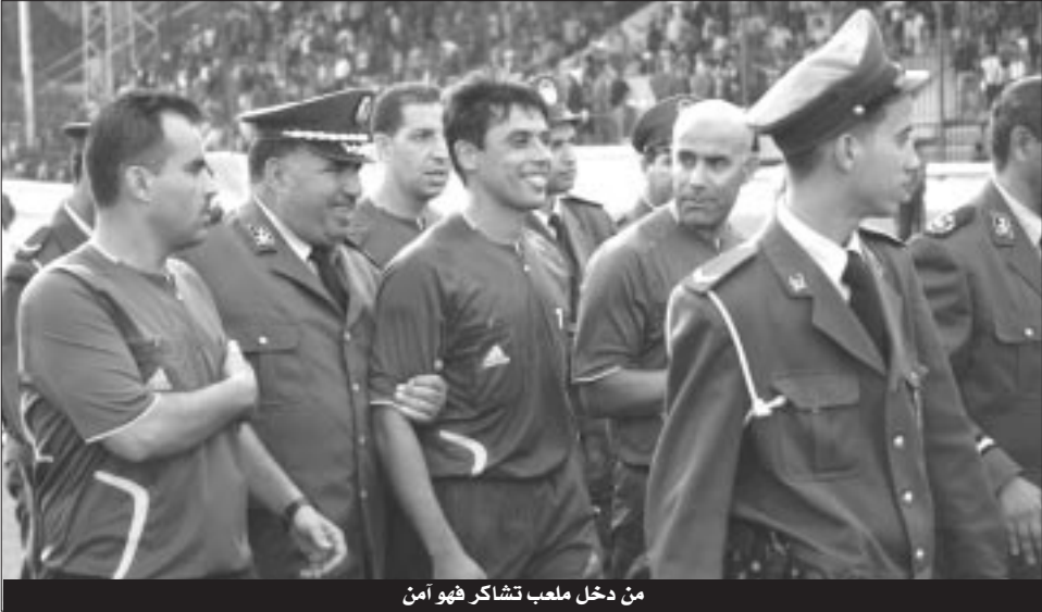
من دخل ملعب تشارك فهو أمن

كما علم أنه تم تجنيد مروحيتين لرصد أية تحركات مشبوهة وتنظيم الحركة المرورية، وتقوم مصالح الشرطة من جهتها بتأمين محيط الملعب الذي يخضع لعملية "مسح" باستخدام كواشف المتفجرات وعملية تمشيط باستخدام الكلاب البوليسية، وأفاد مصدر مسؤول في المديرية العامة