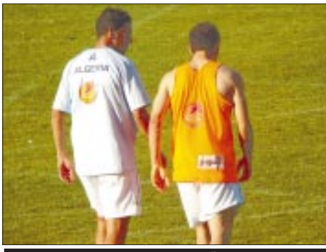
خبرة أشيو ورحو في خدمة الأخضر