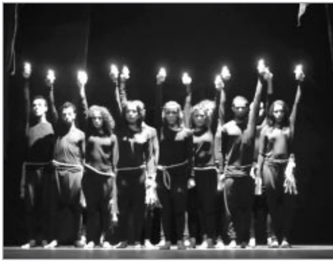
عاصمة أديبة للثقافة العربية، فأهدوا فرحتهم إلى كل مبدعي فلسطين الصامدين رغم كل شيء والمصرّون على المقاومة بالمسرح والموسيقى والكتابة دعماً للمقاومة المسلحة.

لم تحجب لجنة تحكيم مهرجان الوطني للمسرح المحترف أي جائزة رغم إجماعها على المستوى المتوسط للعروض في هذه الطبعة، وعبرت عن أملها في أن تصقل مواهب الممثلين أكثر في السنوات المقبلة، وكشفت عن تشجيعها للترسانة الشبابية التي غيّبت ديناصورات المسرح هذه السنة.