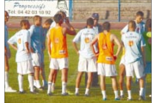
سعدان للاعبين.. أنتم من يصنع الانتصار