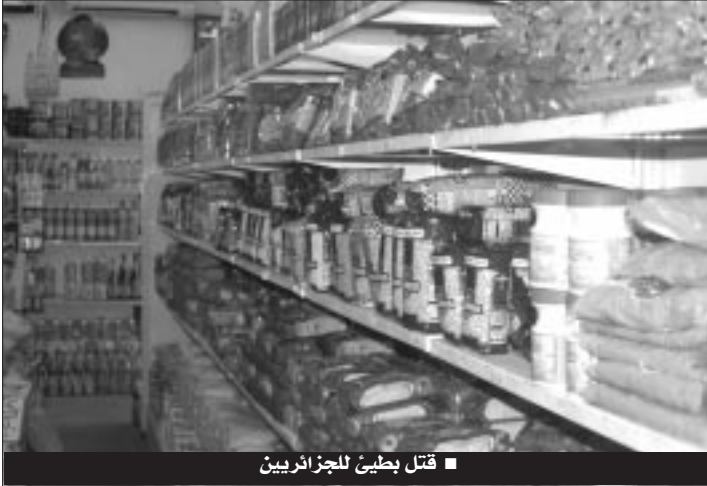
قتل بطيبي للجزائريين

كشفت تحريات لمصالح الرقابة وقمع الغش التابعة لوزارة التجارة عن قيام شركة إسبانية بتزويد مؤسسات جزائرية بتجهيزات صناعية تسمح بخلط كميات كبيرة من مادة السكر مع بودرة القهوة بطريقتي لا تثير انتباه المستهلكين الجزائريين وهو ما تسبب في انعكاسات صحية خطيرة لدى مرضى السكري من النوع الأول والثاني، ومرضى الضغط الشرياني الممنوعين طبيا من استهلاك السكر.