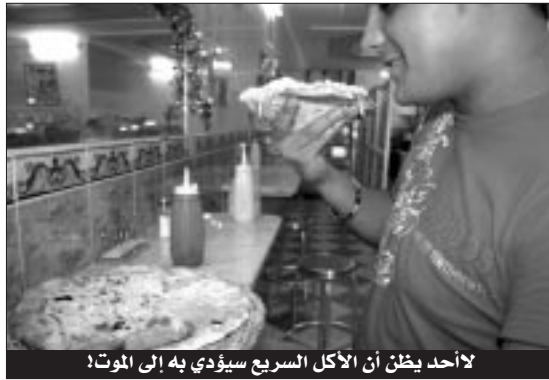
لا أحد يظن أن الأكل السريع سيؤدي به إلى الموت!

وأضاف المتحدث أن انتشار ثقافة المأكولات السريعة التي تضم كميات