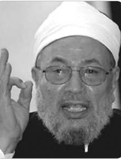
ورعايته لتغير الظروف.

وهناك خلل في العلاقة بأهل الذمة من النصارى والأقباط وغيرهم، وما لهم من حقوق مرمية، وحرمان مصونة. وهناك خلل في فقه تغيير المنكر بالقوة، وما له من شروط يجب أن تراعى. وهناك خلل في فقه الخروج على الحكام، وما صح فيه من أحاديث وفيرة تصيده وتضبطه، ولا تدع باباه مفتوحا على مصراعيه لكل من شاء. وهناك خلل في فقه التكفير، فقد توسعوا فيه وأسرفوا، وأخرجوا الناس من الملة بغير دليل قطعي. وعلى أن ناقش ذلك كله في ضوء الأدلة