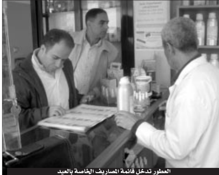
العطور تدخل قائمة المصاريف الخاصة بالعيد

وعن طريقة صنع هذه العطور، أضاف صاحب محل مماثل بباب الزوار إنه يمزج الكحول الذي يُطلق عليه اسم إيتانول بالمادة الأولية المستخلصة المتمثلة في عطر مركز خالي من الكحول يتم جلبه