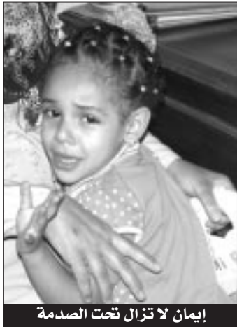
إيمان لا تزال تحت الصدمة

أخرى قالت لأمها، إن أحد أعمامها اعتدى عليها... وأن الثاني فعل الشيء ذاته... في حين أخذ عمها الثالث سكيناً ووضع فوق رقبتها بقوة وقال لي: «إذا حكيت لأحد ما