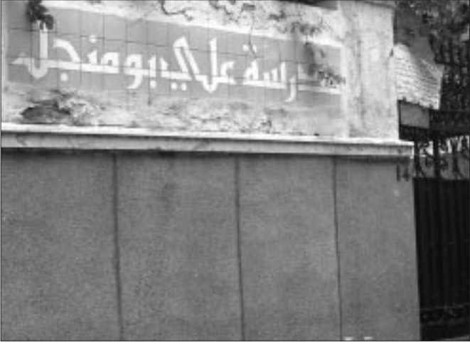
حراس المدارس بالجزائر الوسطى

من جهته، يطرح القرار استفسارات عديدة عن الوضع الأمني الذي ستواجهه المؤسسات التربوية المعنية بالإجراء، سيما وأن الفترة التي جاء فيها تتزامن مع العطلة الصيفية للتلاميذ، حيث تتطلب المحافظة على العتاد والوسائل يقظة وتفتطنا