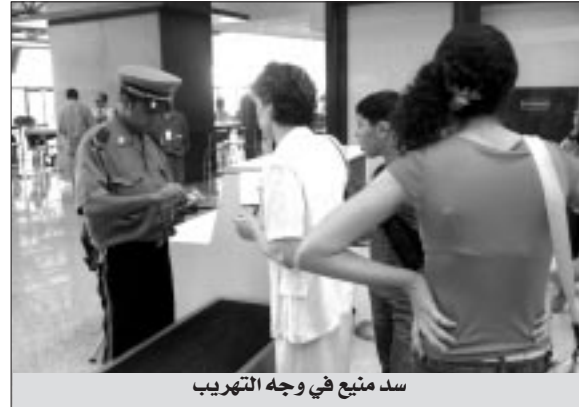
سد منيع في وجه التهريب

بريدي لم يجمرك في الاجال وهو عدد من مجموع 52 الف طردت تمت اجراءاتها بدون تسجيل اي خلل. وبأهم المستودعات على مستوى المطار شحن فقد سجل 969 تصريح بمستودع "اي.بي.سي" و 440 بمستودع "فيدكس" و 7894 تصريح اخر بمستودع "دي.اش.ال" وبلغ على التوالي وزن السوردرات والصادرات بالمستودعات المذكورة ستة الاف طن و 1220 طنو سجلت قباضة المطار شحن في كل العمليات مداخيل بقيمة 16