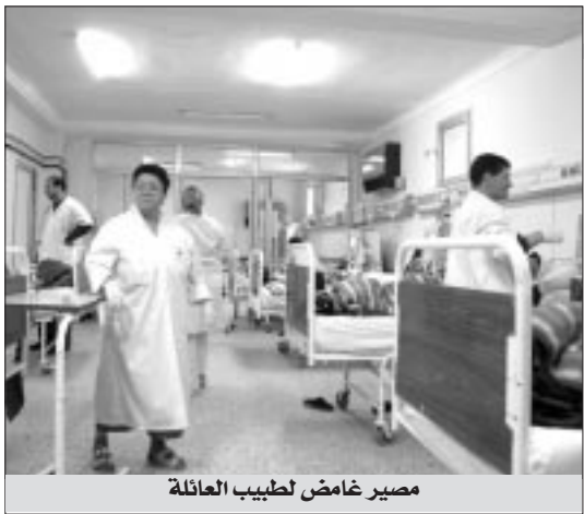
مصير غامض لطبيب العائلة