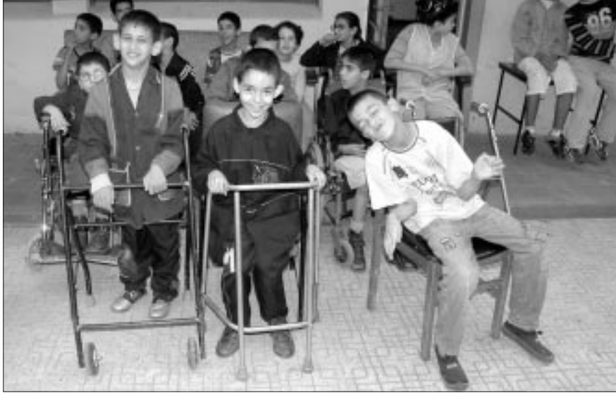
الطلاب ذوي الإعاقة