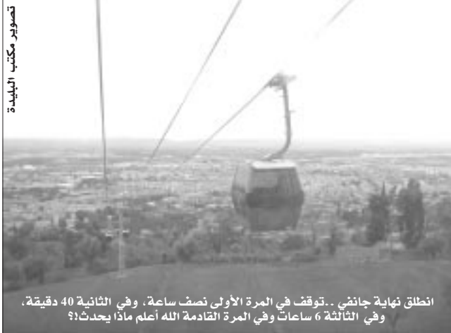
انطلق نهاية جانفي..توقف في المرة الأولى نصف ساعة، وفي الثانية 40 دقيقة. وفي الثالثة 6 ساعات وفي المرة القادمة الله أعلم ماذا يحدث؟

حيث بقوا محتجزين ومعلقين داخل عربات من الخامسة مساء من عصر الخميس الماضي إلى غاية الحادية عشر ليلا، تدخل خلالها رجال درك فرقة زبانة لإنقاذ الموقف وتوفير الأمن لهم. ملاحظة تم تسجيلها، غياب كلي لسيارات الإسعاف أو الحماية المدنية. وتهديّة خاصة المعائنات الثائرة ضد مسيري التيليفريك.