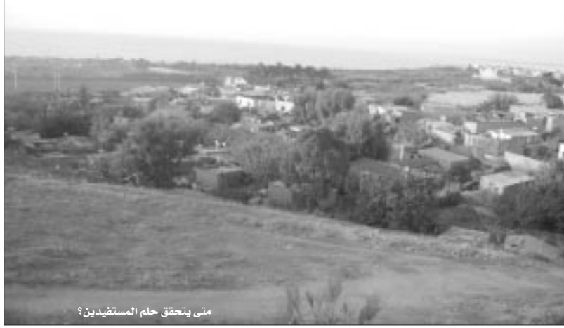
متى يتحقق حلم المستفيدين؟

عبر عدد من المستفيدين من هذا المشروع السكني الكائن بحي الحياة ببلدية الداوودة بولاية تيبازة في اتصال مع "الشروق اليومي" عن استيائهم من تأخر أشغال إنجاز المشروع الذي كان من المفترض تسليمه في ظرف لا يتعدى 18 شهرا، إلا أن المشروع لم ير النور منذ 5 سنوات بالرغم من تسديدهم للدفعة الأولى والمقدرة بـ 60 مليون سنتيم ونظرا لعدم صلاحية أرضية المشروع اضطر صاحب المشروع "شركة العالية للترقية العقارية" لمطالبة المستفيدين بتسديد مبلغ مالي إضافي مقدر بـ 35 مليون سنتيم لإعادة تهيئة الأرضية، وفي نهاية سنة 2008 قام صاحب المشروع بمطالبة المعنيين بدفع بقية المستحقات المالية والمقدرة بـ 45 مليون سنتيم، مما دفع بالمستفيدين إلى مطالبة صاحب المشروع السكني بالالتزام معهم من خلال إبرام