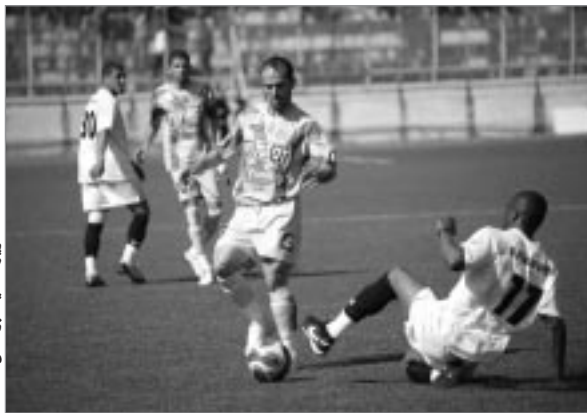
وبجسم المباراة. وحاول الفريق الزائر تقليص الفارق من خلال التسديد من بعيد، لكن كل كراته جاءت عشوائية وتنتهي المباراة بتفوق صريح للمحليين.

حسم الفريق المحلي شبيبة القبائل قمة الملاحظين لصالحه حينما ظفر بالنقاط الثلاث أمام أهلي البرج وتقدم عليه بهدفين وثلاث نقاط كقارق.