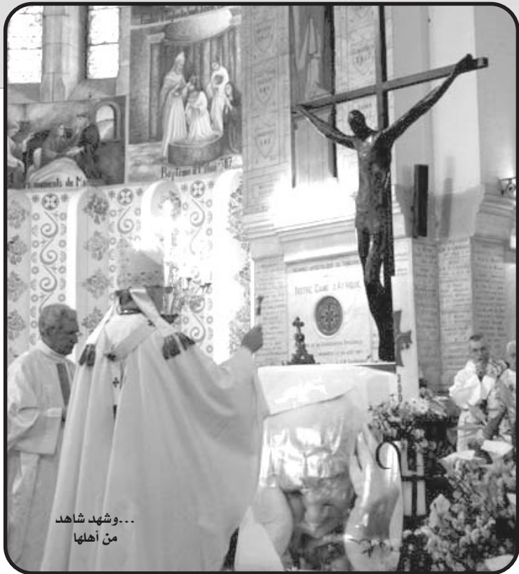
...وشهد شاهد من أهلها

ومثلما يفعل بنو ملتها الجديدة، لا يتنصرون لأنفسهم حتى ينالون من الإسلام والمسلمين، وعلى رأسهم نبي الإسلام محمد عليه أفضل الصلوات، وحتى دون إدراك كلي للأمور من قبل الصبي لم تفوت تلك القربة الفرصة لتشوه صورة خير الأنام وتصفه بأقبح النعوت وأقذر الصفات (حاشاك حبيب الله وأنا أنقل ما سمعته عنك فذاك أبي وأمي يا رسول الله)، كما كانت تقارب بين أحداث العالم في تلك الفترة من حروب في أفغانستان والعراق والشيشان وكانت حروبا صليبية، لكنها كانت تتعمد أن تظهر للصبي من خلالها الإسلام كدين عنف واعتداء ليربط هو الصور في ذهنه بما يراه من "طبيعة" مأكرة و"هدوء" منقطع النظير للمؤمنين والمتمسحين وهم يؤدون صلواتهم على وقع القيثارة والبيانو في أماكن عبادة اختلقوها لأنفسهم في بيوت أحسنهم جاها وأوفرهم أموالا وماديات.