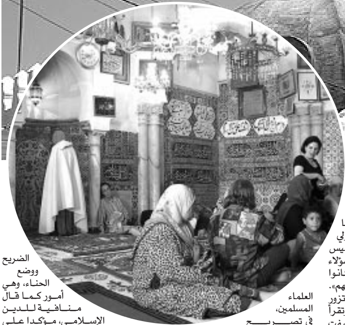
الضريح ووضع الحناء، وهي أمور كما قال

منافية للدين الإسلامي، مؤكدا على ضرورة تشكيل لجنة تتكون من ورثة الشيخ وأهله تشرف عليها وزارة الشؤون الدينية يقومون بخدمة هذا الضريح وتوعية الناس ومنع الاختلاط بتخصيص يوم للرجال وآخر للنساء، ومنع دخول الأطفال وهي قاعدة صحيحة يجب أن تطبق على كل الأضرحة.