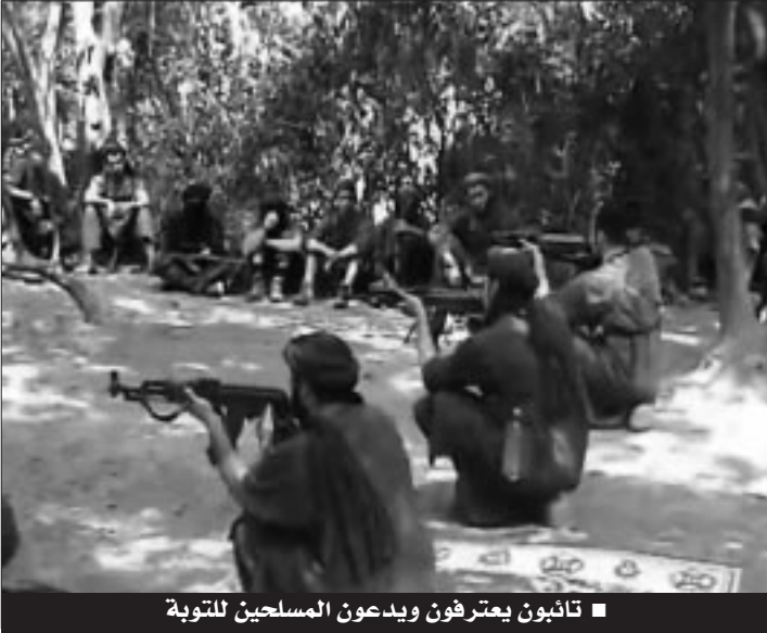
■ تائبون يعترفون ويدعون المسلحين للتوبة

واستباحة دماء وحرمان المسلمين.. والعبارة لمن اعتبر".