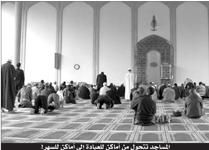
المساجد تتحول من أماكن للعبادة إلى أماكن للتسمر!

في بيوت أذن الله أن ترفع ويذكر فيها اسمه... أذن بعض المواظبين على أداء صلاة التراويح في شهر رمضان لأنفسهم أن يجتمعوا ويتسامروا على صينيات الشاي والفلوز السوداني وقلب اللوز أثناء إلقاء الإمام للدرس الذي يسبق الصلاة ليضربوا بذلك عصفورين بحجر واحد... تحصيل الحسنة خلال هذا الشهر الفضيل واستغلال الوقت قبل الصلاة في السؤال عن أحوال البلاد والعباد!