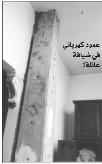
عمود كهربائي في ضيافة عائلة!

المغلقة حيث تكسر الأبواب، وبالنسبة لحوادث الغاز، أفاد حاليتيم أنها تنتج عن التسربات التي تحدث بالمنازل، موضحة أن أغلب التسربات "تسبب فيها المقاولون أثناء أشغال البناء، عقب تخريب الشبكة وإهمال التسربات دون الإخطار عنها"، وعليه أكد المتحدث أن هناك عددا من الشكاوى التي أودعتها "سونلغاز" لدى العدالة ضد هؤلاء المقاولين. وقد أدى تضاعف التطور المعماري وغير الخاضع للمعايير، في الأونة الأخيرة، عبر كبريات المدن، وهو ما سمح بإقامة بنايات فوق شبكات الغاز والكهرباء، ومن أبرز الأمثلة المسجلة بالعاصمة نجد أحياء باب الزوار، الحمير، جسر قسنطينة، الشراقة والحمير، ويشرق البلاد مدينة سطيف الجديدة، العلة وقسنطينة. هذا، ويقطن قرابة ألفين عائلة فوق قنات 20 ملم لشبكة الغاز، بحي 1850 مسكن بحاسي مسعود، وقد خصصت المديرية العامة لـ "سونلغاز" ثلاثة ملايين سنتيم لتحويل الشبكة، غير أنها وجدت صعوبة في إتمام التحويل بعد فض السكان للعملية، وهو الأمر الذي ينذر بكارثة عند ارتفاع درجات الحرارة نتيجة فساد ميكانيزم الاسترخاء بالعداد.