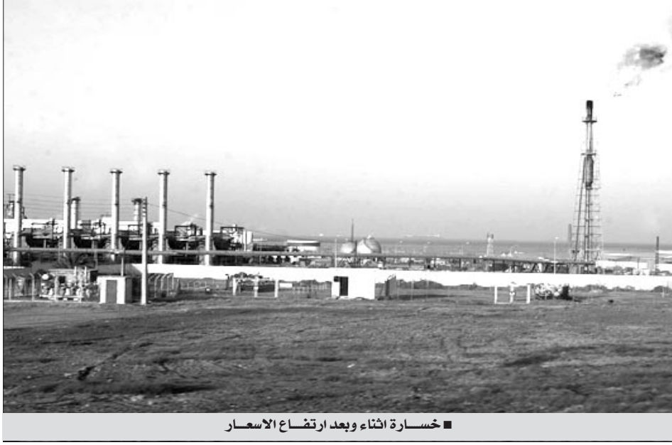
■ خسارة أثناء وبعد ارتفاع الأسعار