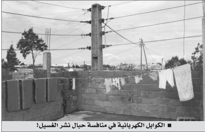
الكوابل الكهربائية في منافسة حبال نشر الغسيل!

قتل 57 شخصا نتيجة الصعقات الكهربائية الناجمة عن قرب الاتصال بين المواطنين وشبكات الكهرباء ذات الضغط العالي الموزعة عبر أنحاء الوطن، والضغط المنخفض داخل المنازل إلى جانب تسربات الغاز، في السداسي الأول لسنة 2008، فيما أصيب 98 شخصا بجروح وحرانق، في آخر حصيلة سجلتها مديرية الوقاية والسلامة الصناعية لشركة الكهرباء والغاز "سونلغاز"، وتحصلت "الشروق اليوم" على نسخة منها.