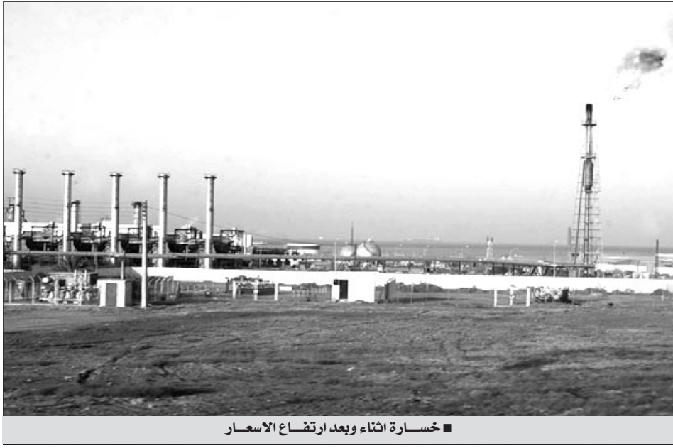
■ خسارة أثناء وبعد ارتفاع الأسعار

لبرنامج تعزيز النمو. وأشار المتحدث إلى أن الخسائر في الأرباح ستصل إلى 72 مليار دولار في حال نزول أسعار النفط إلى 50 دولارا للبرميل وهو ما يعني خسارة تعادل 178 بالمائة من الحساب تراجع الأسعار بـ 40 دولارا سنويا كما هو مسجل حاليا فإن الخسائر في الأرباح بالنسبة لدولة مثل الجزائر تصبح معتبرة جدا وتصل إلى 39 مليار دولار وهو ما يعادل 109 بالمائة من الاستثمار السنوي ضمن برنامج تعزيز النمو الذي خصصت له الحكومة 200 مليار دولار، وفي حال تطبيق السعر الحقيقي للغاز المقيم حاليا بنصف سعره فإن الخسائر في الأرباح هي 30 مليار دولار، وهي الخسارة التي يتوقع أن تصل إلى 51 مليار دولار في حال نزول سعر البرميل إلى 80 دولار للبرميل وخسارة العملة الأمريكية بـ 153 بالمائة من قيمتها، ما يعني خسارة في الأرباح تقدر بـ 157 بالمائة من المبلغ السنوي