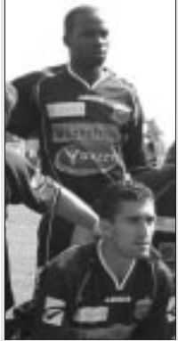
أجرى فريق مولودية الجزائر مباراة ودية سهرة أول أمس ضد المنتخب العسكري إنتهت بخسارة العميد (2-1).