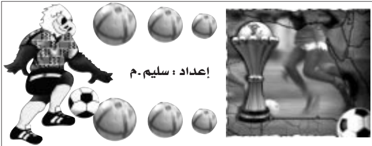
إعداد : سليم م.

ومن جانبهم، يرفض المصريون في غالبيةهم العظمى السحر والشعوذة، لتعارضهما مع تعاليم الدين الإسلامي ولذلك فإنهم يتفاعلون باللجوء لشيوخ الإسلام لعمل أحجبة لهم والدعاء لهم لكي يوقفهم الله في البطولات التي يلعبونها.