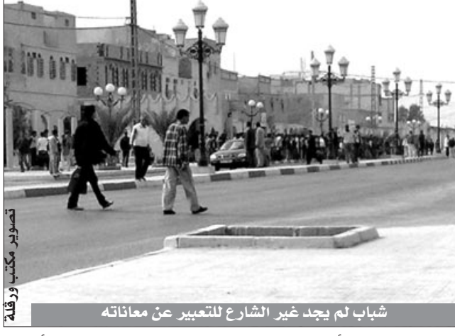
شباب لم يجد غير الشارع للتعبير عن معاناته

من جهة ثانية، أقدم مطلع هذا الأسبوع العشرات من البطالين بمنطقة في حاسي مسعود، عاصمة الذهب