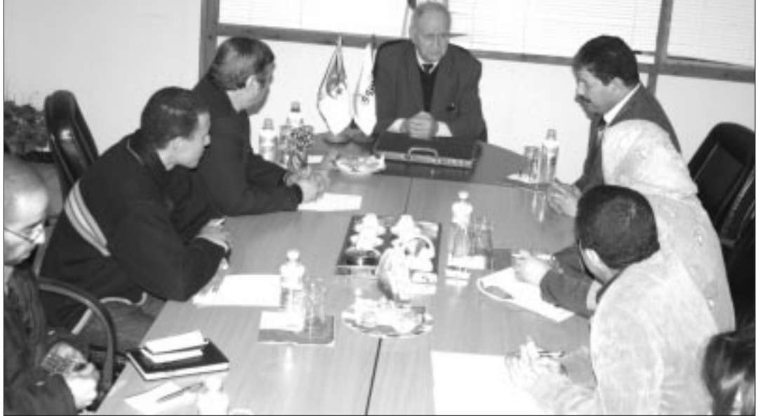
أسقف الجزائر هنري تيسي يعثر الفلوق (أسن)

أكد أسقف الجزائر، هنري تيسي، أن السلطات الجزائرية مطالبة قبل تطبيق قانون تنظيم ممارسة الشعائر الدينية لغير المسلمين، بالنظر إلى الجوانب الإنسانية التي يقوم بها رجال الدين المسيحيين، رافضا أن تتدخل جهات قضائية لفرض الرقابة وتضييق الخناق عليها للقيام بواجباتها الإنسانية، وأكد أن حالات المنع وتكبير تظاهراتهم بوجوب الترخيص لها، لن تلقى الاستجابة لديهم، مطالبا باسترجاع كنائسهم من وزارة الشؤون الدينية في حال تعرضوا لمضايقات أكبر.