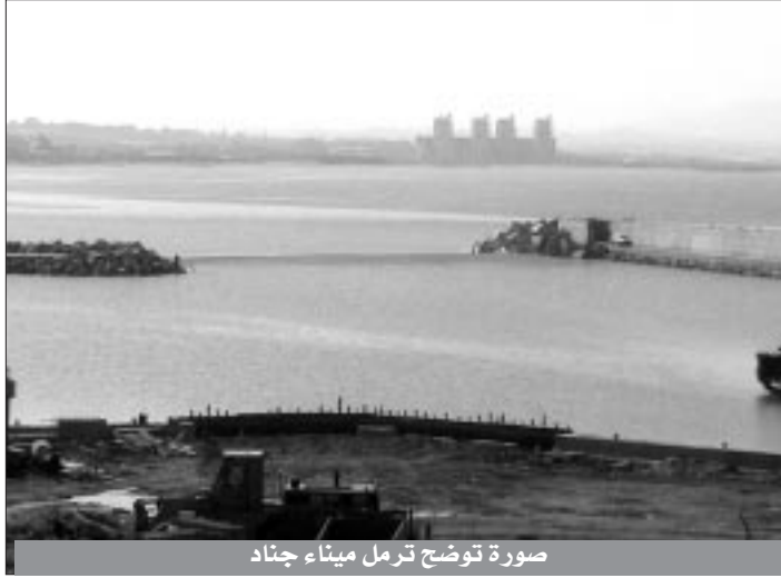
صورة توضح ترمل ميناء جناد

العديد من ذوي الاختصاص حاولوا إقناع المصالح المكلفة بالدراسة بحكم خبرتهم بفشل المشروع، غير أنهم لم يفلحوا في ذلك، وحتى لجنة الفلاحة حول الصيد البحري التي قدمت تقريرها