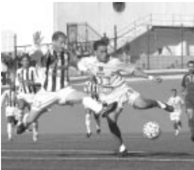
لقطة من مباراة أمس

خطف فريق مولودية وهران نقطة من مضيفه نصر حسين داي في مباراة لم ترتق للمستوى، وانتهت باحتجاجات كبيرة لمسيريين ومنافس النصرية. بداية المباراة كانت قوية من المحليين الذين فرضوا ضغطا كبيرا في غياب فعالية خط الهجوم، وكانت أول لقطة من كرة ثابتة نفذها قانا من بعد 22م، لكن زميله السابق الحارس جبرات ينقذ الموقف في الدقيقة 14. وكانت أول لقطة من جانب مولودية وهران على إثر كرة مررها سباح إلى داود سفيان الذي ارتدى الكرة برأسية، لكنها جانبت القائم. وفي الدقيقة الأخيرة من الشوط الأول قاد مهاجم النصرية موسى محمد هجوما خاطفا ويفتح، لكن جبرات كان في الموعد وينقذ مرماه. ولم يأت الشوط الثاني بجديد وسط محاولات من الجانبين، ففي الدقيقة 52 عطفان يسد مخالفة على الجهة اليسرى علق يسد وجبارات ينقذ الموقف. وفي الدقيقة 63 نفذ حدو مخالفة مباشرة أبعدها عسلة إلى الركنية، وكانت أبرز لقطة من المحليين في الدقيقة 78 بعد أن راوغ عطفان وقذف، لكن جبرات كان دائما في الموعد.