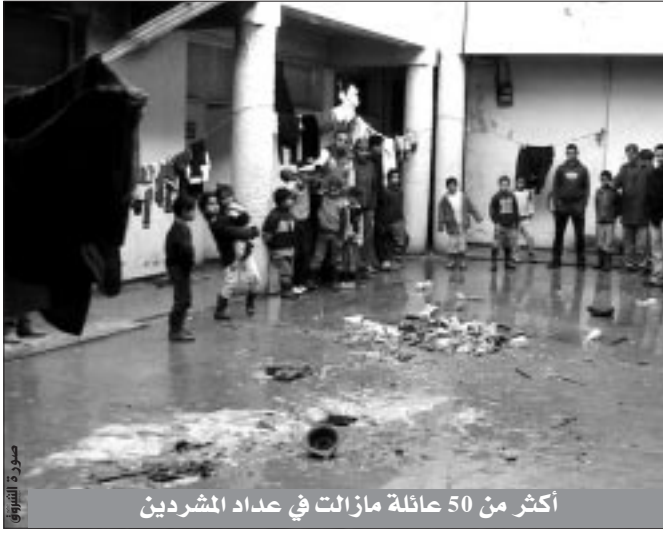
أكثر من 50 عائلة ما زالت في عداد المشردين

المتواجدة على مستوى المركز الترفيهي بحي المجني، وعددها 42 عائلة، تعيش وضعية جد مزرية، حيث يتقاسم أكثر من 150 فرد بضع غرف مهترئة الجدران، تتسرب منها مياه الأمطار، صباح الأطفال ينبعث من كل مكان، وثيابهم مبتلة جراء مياه الأمطار التي ملأت شبه الغرف. كما تتقاسم هذه العائلات مرحاضا واحد شبه منهار، وملء بالجرذان، فضلا عن انعدام المياه الصالحة للشرب والكهرباء.. وضع مأسوي تعانيه هذه العائلات التي جاءت من حي الكاريار وتقدمت، وزج بها في هذا المكان قبل أن تتخلص السلطات المسؤولة عن مسؤوليتها. هذه العائلات أكدت أن رئيس الدائرة مطلع على وضعيتهم، حيث سبق أن وعدهم بالتكفل بوضعيتهم، قبل أن يتراجع، دون أن تحرّكه صيحات الأطفال التي أصبح التعليم آخر أحلامهم، وكل ما طلبوه هو