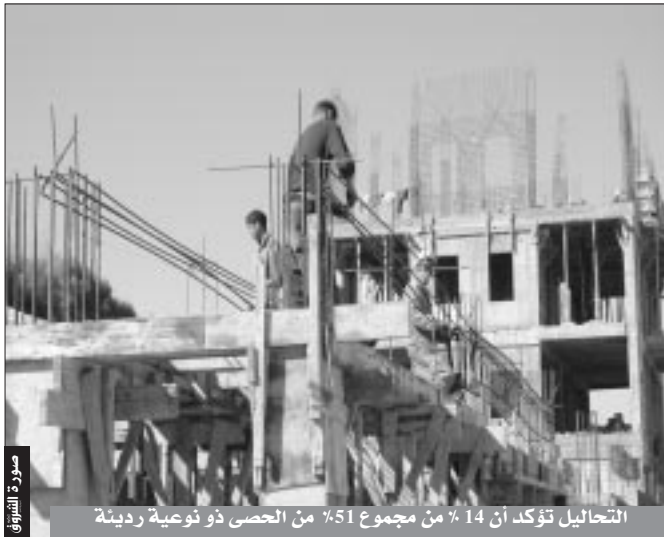
التحاليل تؤكد أن 14 ٪ من مجموع 51 ٪ من الحصى ذو نوعية رديئة

تمكن مركز المراقبة التقنية لوكالة تبيازة من إجراء أكثر من 600 تحليل لنوعية الخرسانة والحديد والرمل والحصى والإسمنت المستعملة في عمليات إنجاز المشاريع العمومية سواء السكنية أو المرافق والمنشآت المختلفة.