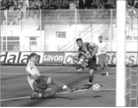
لقطة من مباراة أمس

حارس الشبيبة نجوكام بصعوبة وحاول أصحاب الأرض إحداث الفارق في الشوط الثاني، وكثفوا من هجماتهم في محاولة لهز شبك الحارس نجوكام الذي تصدى ببراعة لمحاولات بن طيب، عمور ويوسفان. وشهد هذا الشوط خروج دزيري متأثرا بالإصابة، ما أفقد الاتحاد تركيزه في وسط الميدان.