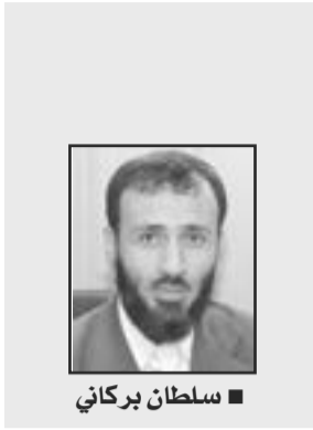
■ سلطان بركاني

لا تزال أيام شهر ربيع الأول تتوالى؛ هذا الشهر الذي اصطلحت الأمة على تسميته بربيع الأنوار.. وحق له أن يسمى كذلك.. كيف لا وهو الشهر الذي ولد فيه نبي الهدى صلى الله عليه وآله وسلم، والشهر الذي بعث فيه، والشهر الذي هاجر فيه إلى المدينة المنورة.. ارتأت الأمة المسلمة أن تحتفي بهذا الشهر كل عام، وجرت عادة المسلمين بأن يستذكروا في أيامه أهم المحطات في سيرة الحبيب المصطفى عليه الصلاة والسلام، ويتذكروا حقوقه التي أوجيها له الله جل وعلا على الأمة المسلمة.