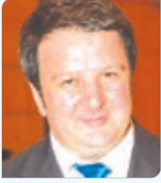
بقلم السيد: رفايل بغير وف القائم بأعمال سفارة أذربيجان بالجزائر

حققت جمهورية أذربيجان انتصارا رائعا في 44 يوما وهزمت أرمينيا، منبهة الاحتلال. كل يوم من هذه الأيام الـ 44 هو تاريخنا المجيد. لقد قاتل الجندي والضابط الأذربيجاني لهدف واحد لإنهاء هذا الاحتلال والظلم والتسود العدالة التاريخية وقد حققنا هذا. كانت أراضي أذربيجان تحت الاحتلال لمدة تقرب من 30 عاما. في بداية التسعينيات، أدت سياسة عدوان أرمينيا على أذربيجان إلى احتلال أراضيها. في الواقع، بدأت السياسة العدوانية لأرمينيا في أواخر الثمانينيات. في ذلك الوقت، تم طرد 100 ألف أذربيجاني كانوا يعيشون في جمهورية أرمينيا الحالية من أراضي أجدادهم. مقاطعات زانجازور وشوشا وإيرافان هي الأراضي التاريخية لأذربيجان وشعبنا يعيش في هذه الأراضي منذ قرون. لكن القيادة الأرمينية شررت 100 ألف أذربيجاني من موطنهم الأصلي في ذلك الوقت. بعد ذلك، لوحظ نفس الوضع في ناغورنيكاراباغ. حيث ارتكب الجانب الأرميني بالقوة جريمة حرب ضد سكان أذربيجان المسلمين، وارتكب الإبادة الجماعية في مدينة خوجالي.