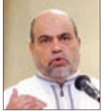
● بقلم: أبو جرة سلطاني

ذو القرنين رجل صالح مكن الله من أسباب القوة ما يعينه على إنقاذ صلاحه في من تسوقه الأقدار إليهم. وأعطاه الله من الأسباب ما يجعله موفقاً في سيرة حياته كلها: «إِنَّا مَكَّنَّا لَهُ فِي الْأَرْضِ وَآتَيْنَاهُ مِنْ كُلِّ شَيْءٍ سَبَبًا» (الكهف: 84). فالله هو مؤتي الملك وميسر التمكين ومسخر الأسباب.. فهو من أعطى نمرود الملك ولكنة سلبه التوفيق: «أَلَمْ تَرَ إِلَى الَّذِي حَاجَّ إِبْرَاهِيمَ فِي رَبِّهِ أَنْ آتَاهُ اللَّهُ الْمُلْكَ» (البقرة: 258)، فلما طغى سلبه ما أعطى من أضعف ريش وبأوى سبب.