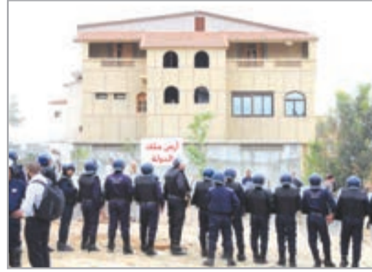
عقوبات تصل 15 سنة سجنا

في حق المخالفين والأشخاص الذين يستولون على أراضي الدولة بطريقة غير قانونية يُحدد المشروع القواعد الإجرائية التي تتلاءم مع المكافحة الفعالة للجرائم الواقعة على أراضي الدولة، من خلال تحديد الأعراف المؤهلين للبحث عن الجرائم المنصوص عليها في هذا المشروع ومعاينتها، إضافة إلى ضباط وأعاون الشرطة القضائية. كما يمنح المشرع لهؤلاء صلاحية القيام بزيارات ميدانية مفاجئة لأراضي الدولة مع إمكانية فتح تحقيقات برونها مناسبة مع طلب إبلاغهم بالمستندات التقنية المتعلقة بها.