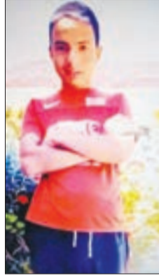
مناطق، إلى غاية مساء الخميس، حيث عثر على

الذي يؤدي خدمته العسكرية وعاد مؤخرا إلى المنزل، إلا أنه تمكن وعلى حين غفلة من مغادرة المنطقة التي لا يتجاوزها عادة، وهذا تزامنا مع تهاطل غزير للأمطار، ليعلم أفراد الأسرة حالة الطوارئ إلا أنه لم يتم العثور عليه. وقد حامت شكوكا حول اختطافه باستعمال سيارة، وبعد بلاغ لعناصر الدرك الوطني ورجال الحماية المدنية، تم تكثيف البحث بعدة