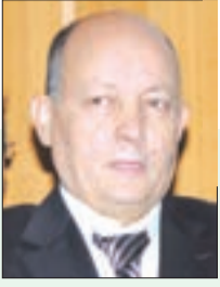
■ عمار تو وزير سابق

في اتجاه الفكر النقدي نفسه للمأخذ الموجهة لنفس المخطط الوطني للتنمية الفلاحية المذكور آنفاً، كثير هي برامج هذا المخطط التي فشلت فشلاً ذريعاً أدى إلى إعادة جدولة تبعية الجزائر إلى استيراد كثير من المنتجات الأخرى المصنفة ضمن المنتجات التي تدخل في تحديد الأمن الغذائي للجزائر.