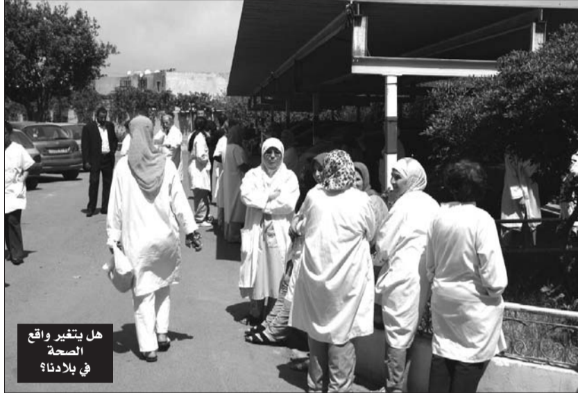
هل يتغير واقع الصحة في بلادنا؟

360 منصب أمينة طبية حاصلة على شهادة دولة، و480 مشغل لأجهزة الأشعة ذوي شهادة دولة ويشترط في المترشحات أن يكن حاصلات على شهادة البكالوريا في شعب علوم الطبيعية والحياة، العلوم الدقيقة والكيمياء، الآداب واللغات الأجنبية، الآداب والعلوم الإنسانية والآداب والعلوم الإسلامية، يخضع المترشحون المقبولون لمتابعة بنجاح تكوين متخصص لمدة ثلاث سنوات في المدارس شبه الطبية والمعاهد التكنولوجية للصحة العمومية أو مؤسسات التكوين الأخرى، وتفتح كل هذه المسابقات لشعب العلوم التجريبية وهندسة الطرائق.