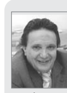
بقلم: أ. د. / محمد قيراط

التخويف وزعزعة الأمن والإفساد في الأرض. وهذا ما يناقض روح الشريعة ومقاصدها، فقد أكد الإسلام على حرية الاعتقاد ورفض استخدام القوة لمبررات تبشيرية "لا إكراه في الدين" (البقرة: 652)، والعدل والإنصاف مع أعدائنا والمخالفين لنا، "يا أيها الذين آمنوا كونوا قوامين لله شهداء بالقسط، ولا يجرمنكم شنآن قوم على ألا تعدلوا اعدلوا هو أقرب للتقوى، واتقوا الله، إن الله خبير بما تعملون" (المائدة: 8)، كما أكدت على قيم التسامح والرحمة "وما أرسلناك إلا رحمة للعالمين" (الأنبياء: 107). من يناقض هذه القيم والمبادئ باسم الإرهاب يعيش تحملا تشويشا وخللا في العقول والضمائر، يقول المصطفى الأمين، صلى الله عليه وسلم "يحقر أحدكم صلاته إلى صلاتهم، وقيامه إلى قيامهم وقراءته إلى قراءتهم، يقرؤون القرآن لا يجاوز حناجرهم". فلم يفهم هؤلاء القرآن بشكل صحيح وبأنه قد منع الإرهاب بكل أشكاله، ابتداء من العنف الكلامي الذي نهي عنه الرسول - صلى الله عليه وسلم - وطلب من المسلمين الالتزام بالرفق واللين والكلمة الطيبة، وصولا إلى القتل وهو أشد أنواع الاعتداء "من قتل نفسا بغير نفس أو فساد في الأرض فكأنما قتل الناس جميعا" (المائدة: 23). لقد حرم الإسلام جميع أنواع الإرهاب وأشكاله وممارساته، واعتبرها ضمن جريمة الحراية، أينما وقعت وأيا كان مرتكبوها، فقد يكون الإرهاب من دولة أو دول على دول أخرى. إن المتفحص لآيات القرآن الكريم والسنة النبوية الشريفة سيلمس