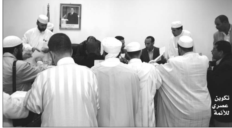
تكوين عصري للإمامة

وضعت وزارة الشؤون الدينية والأوقاف شروطا جديدة للراغبين في الالتحاق بمختلف المناصب المالية التي تتيحها ابتداء من الدخول الاجتماعي المقبل، حيث وضعت برنامجا خاصا يخضع فيه المتقدمين إلى حجم ساعي يصل إلى 32 ساعة أسبوعيا.