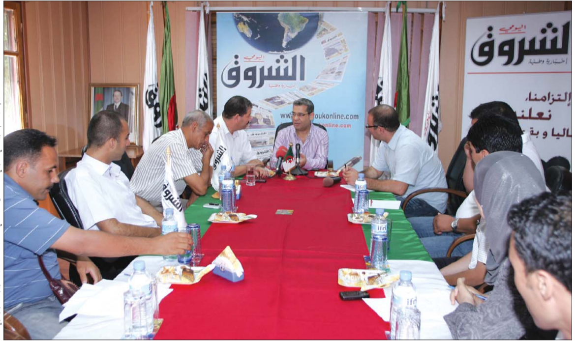
نجم الإعلام الرياضي العربي مصطفى الأغا في منتدى الشروق

اعتبر مصطفى الأغا أن الكثير من المواقف التي حدثت له في برنامج "صدي الملاعب" على قناة "أم بي سي" على مدى 1500 حلقة كانت محرجة ولم تكن طريفة، وكشف الأغا لـ "الشروق" عن آخر موقف حدث له خلال إحدى الحلقات: "آخر موقف حدث لي كان يوم 5 جويلية، وصادف تبليغ أحد الفائزين في مسابقة البرنامج بفوزه، وعندما اتصلنا به كان نائما وهو الأمر الذي اضطرنا إلى الانتظار 5 دقائق قبل معاودة الاتصال به، ولحسن الحظ أن الحلقة كانت