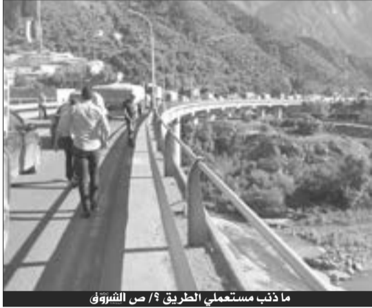
ما ذنب مستعملي الطريق /ع