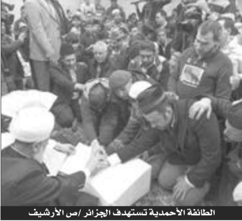
الطائفة الأحمدية تستهدف الجزائر

أصدرت، أول أمس، المحكمة الابتدائية بالجلفة حكمها بستة أشهر سجنا نافذا وغرامة مالية تقدر بعشرين ألف دينار، في حق أمير للطائفة الأحمدية وأتباعه، الذين تم إلقاء القبض عليهم في مدينة حاسي ببحج شمال الجلفة. وكانت المصالح الأمنية في الجلفة قد ألقوا القبض على مجموعة من أتباع الطائفة الأحمدية في حاسي ببحج، المقدر