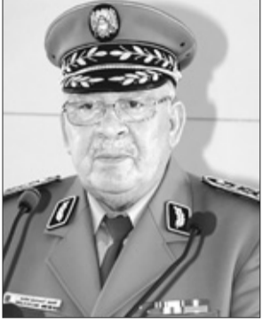
الفريق أحمد قايد صالح

● توقيف 73 عنصر دعم وإسناد للجماعات الإرهابية وحجز أسلحة وذخيرة