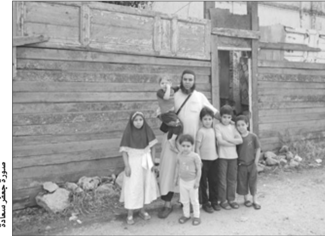
مدرسة جعفر سعادة

وبمتابعة التحريات تم تحديد هويته المشتبه فيه، حيث تبين أنه مسيق قضائيا، وبعد تتبع آخر شريحة مستعملة من طرفه، تم توقيفه بأحد المراكز التجارية وبحوزته 4 جوازات سفر ترجع إلى ضحايا آخرين. وعند مواجهته بالتهمة المنسوبة إليه، اعترف بأنه نصب على الضحية في مبلغ 92 مليون سنتيم. ■ نسرين برغل