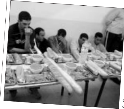
عبد القادر ب

يشهد مطعم الرحمة، المفتوح منذ بداية الأسبوع الجاري من طرف المكتب الولاتي للهلال الأحمر الجزائري بالأغواط، إقبالا كبيرا من طرف المعوزين الذين يصطفون في طوابير طويلة بداية من الصباح الباكر للظفر بالوجبة الساخنة، حيث يقدم المشرفون 150 وجبة متنوعة يوميا للعائلات المسجلة. وقصد الوقوف على العوائق التي تقف في وجه المكتب الولائي، فقد رافقت الشروق الفريق المتطوع في يوم رمضاني حار بداية من طرق أبواب المحسنين الى غاية توزيع الوجبات.