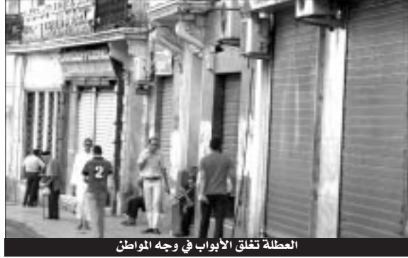
العطلة تخلق الأرباب في وجه المواطنين