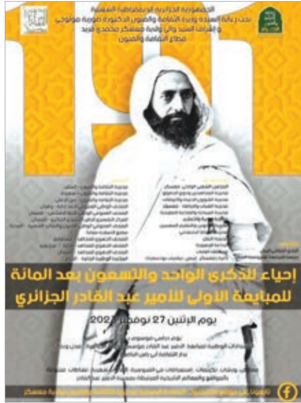
القادر مؤسس الدولة الجزائرية الحديثة بولاية معسكر. كلها مصنفة ضمن التراث المادي الوطني، ويأتي هذا الجهد

وفي كلمتها بالمناسبة والتي ألقاها نيابة عنها السيد عمار نوار مدير الحماية القانونية والممتلكات الثقافية وتثمين التراث الثقافي، أكدت وزيرة الثقافة والفنون أن استرجاع هذا السيف التاريخي، يأتي احتفاء بالذاكرة الوطنية وانتصارا لها ولرموزها الكبار وذلك تطبيقاً لتوجيهات رئيس الجمهورية، عبد المجيد تبون، القاضية بضرورة تعزيز حماية التراث الوطني الثقافي، وصون الذاكرة الجماعية والسهر على استرجاع الممتلكات الثقافية بغية حفظها وتثمينها. كما أكدت الوزيرة أن المواقع التاريخية للأمير عبد