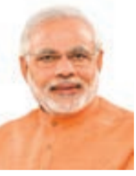
بقلم: رئيس الوزراء الهندي ناريندرا مودي

اليوم يمر 365 يوم على تولي الهند لرئاسة مجموعة العشرين. وقد حان الوقت للتدبير وإعادة التزامنا وإحيائنا لشعار "أرض واحدة، أسرة واحدة مستقبل واحد".